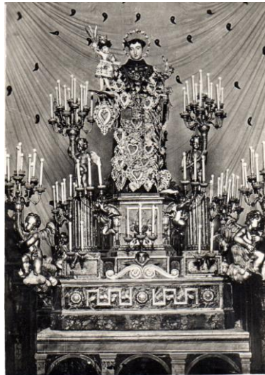
STATUA DI S. ANTONIO DI PADOVA che si venera nella Chiesa di S. Francesco in Rieti